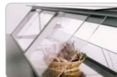
Închideri posterioare Rear doors