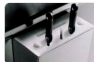
Suport cuțite Knives holder