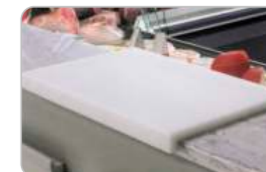
Blat feliere Cutting board