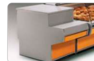
Tejghea Extension counter