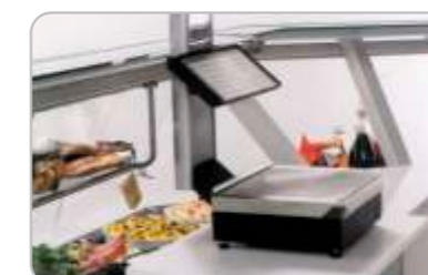
Suport cântar Scale platform